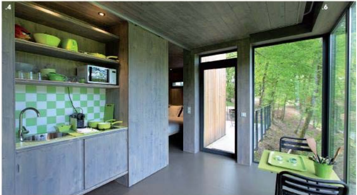
Architecture BOIS N°63